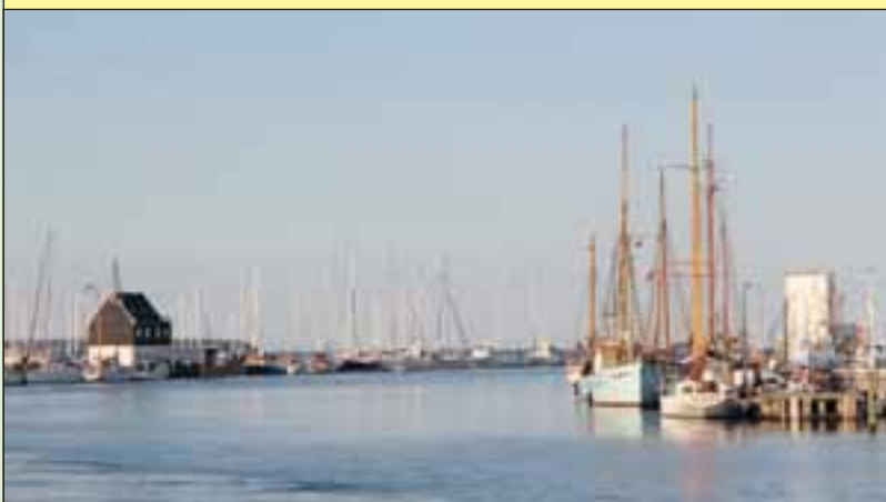
Hvad hedder havnen?

Næste opgave viser endnu en havn fra de danske farvande. Kan du genkende den? Send en mail med svaret til marsejleren@marselisborgsejlkklub.dk . Svarer du rigtigt, vinder du stadig ikke en pind, men du får naturligvis hædrende omtale i næste nummer af Marsejleren!