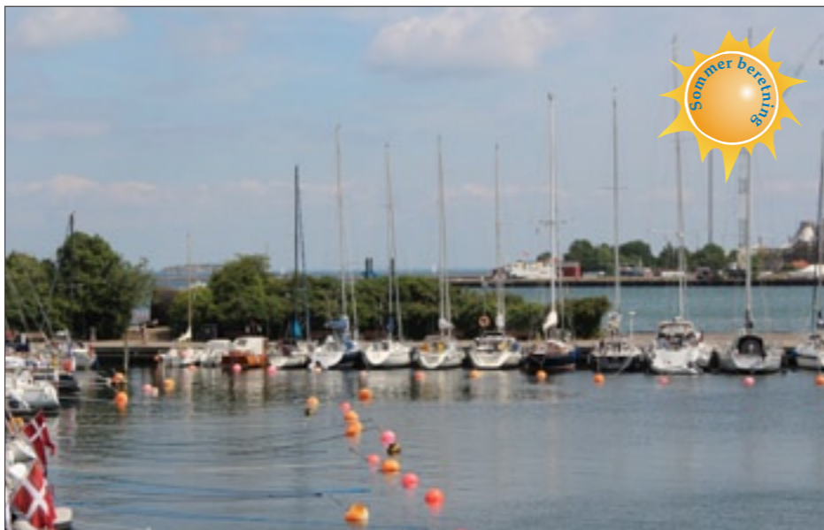
Fortøjring i Langelinie Havn.

Egentlig var det vores plan at gå ind i Mölle, der ligger lige syd for Kullen. Vejrudsigterne meldte dog hård vind fra nordvest de næste mange dage, og af havnelodsen fremgår det, at så skal man ikke gå ind i Mölle, da den er meget urolig ved nordvestvind. Vi valgte i stedet Viken 20 km. sydligere, hvor vi så tog en overliggerdag på dagen med den hårdeste blæst. Den brugte vil til en udflugt til Kullen, hvor vi tog bussen til Mölle for så at vandre de 5 km ud til Kullens spids. Besigtigelse af havnen i Mölle viste, at vi havde valgt rigtigt. Bådene blev smidt rundt mellem hinanden af de urolige døninger, der slap gennem den åbne havnemunding. Så vi nød vandreturen til Kullen og havde det helt fint med at kunne tage bussen tilbage til