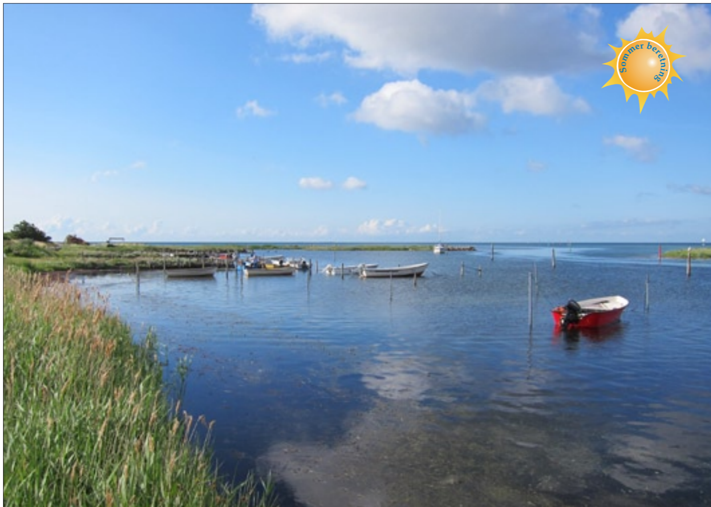
Udsejling fra Noret ved Bisserup Havn

Vi var på vej fra Korsør til Karrebækminde, da vi på søkortet fik øje på Bisserup Havn, der ligger ved indsejlingen til Holsteinborg Nor. Diverse havnelodser omtalte Bisserup som 'idyllisk', 'perle', 'blåt flag' og 'dejlig badestrand'. Dér måtte vi ind! Og lad os bare slå fast, at havnelodserne ikke lyver!