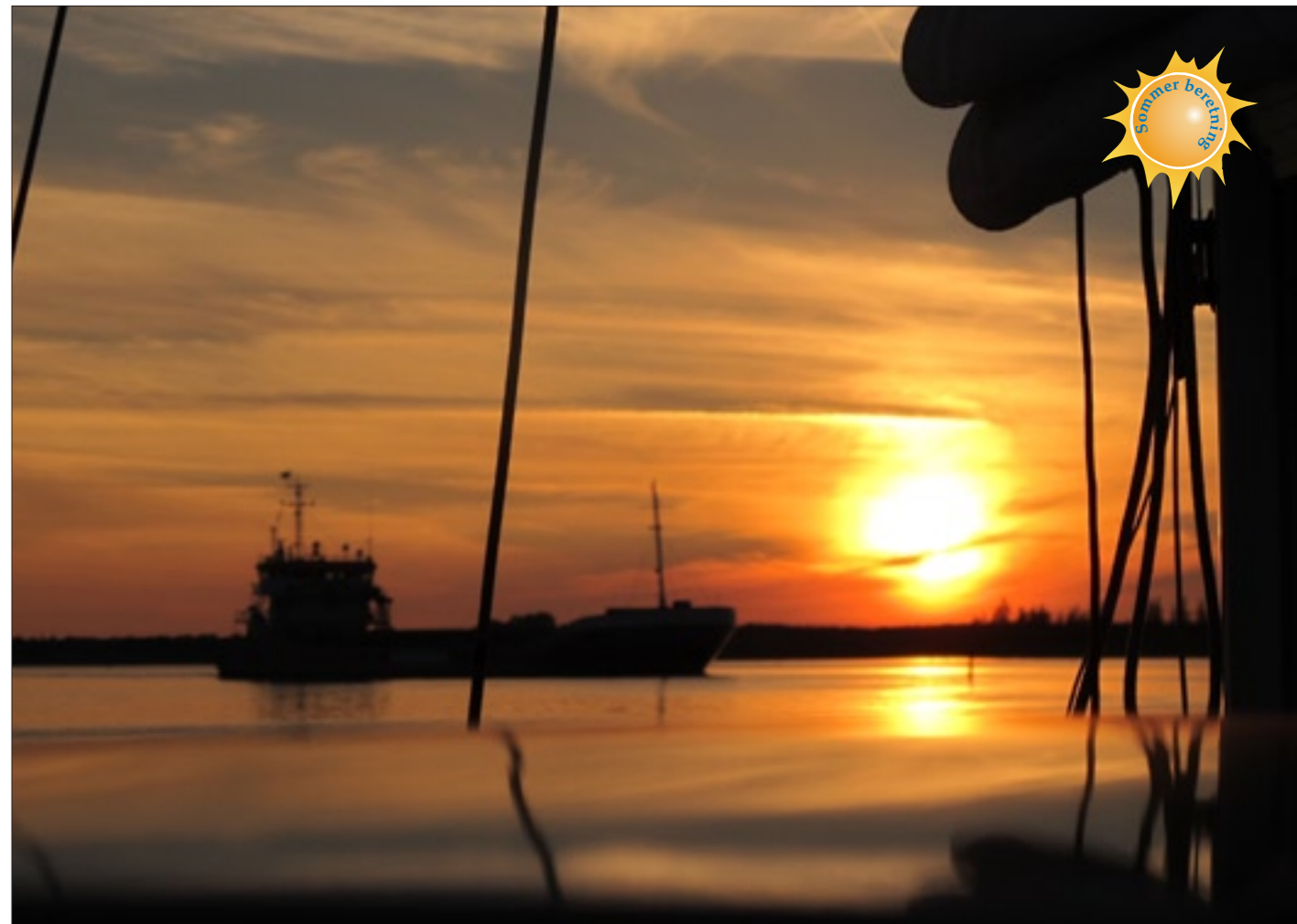
Aftenstemning ved Als Odde i udmundingen af Mariager Fjord

Efter en varm sommerdag for sejl fra Egense, ligger vi om aftenen for svaj ved en bøje nær Als Odde i Mariager Fjord. Den gule DS-bøje er fladtrykt og fyldt med afsmittet bundfarve, så kæresten kommer på arbejde for at nå stangen og få tov igennem ringen. Her ligger vi trygt og godt i det skiftende tidevand, der giver op til halvanden knob strøm. Sejlrenden med 6 meters dybde, og de røde og grønne stager, ligger 25 meter om bagbord, så vi kan fint følge med i de lokales vandskiudfoldelser og de enkelte lavbundede coastere, der brummer forbi. Efter solnedgang ankommer tre motorbåde, der tydeligvis sejler sammen. De ankrer op lidt vest for os, finder fiskegrejet frem og vinden og freden sænker sig.