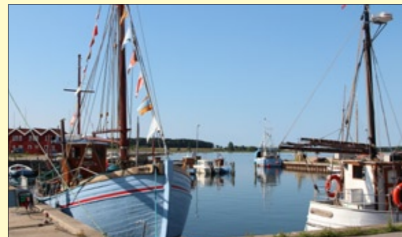
Hvad hedder havnen ?

Næste opgave viser endnu en havn fra de danske farvande. Kan du genkende den? Send en mail med svaret til marsejleren@marselisborgsejlkub.dk. Svarer du rigtigt vinder du stadig ikke en pind, men du får naturligvis hædrende omtale i næste nummer af Marsejleren!