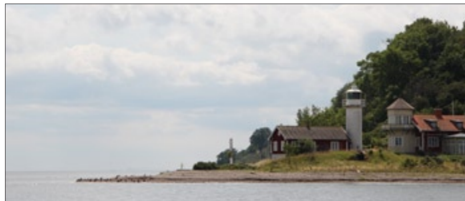
100 m. fra fyret på Vens østside med 30 m. vand under kølen.