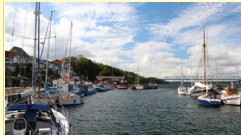
Middelfart Gl. Havn

Sidste gang var vi i Middelfart Gl. Havn, hvilket Åge Thorborg gættede – måske fordi han tidligere har taget et næsten identisk billede.