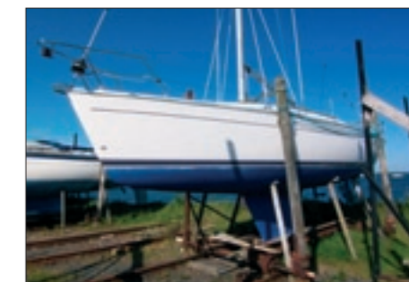
Her er der både seler og livrem: Rulle-vogn, stativ og ekstra støtter.

Det er pladshaverens ansvar at passe sit stativ, herunder smøring og vedligehold, og nu også sammenpakning og klargøring. Husk at fjerne stiger og andre løse dele.