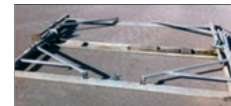
Så lidt fylder stativet, når det er klappet sammen.