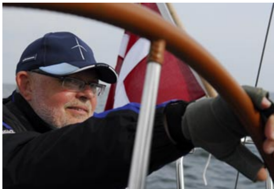
Jeg kan kun opfordre nye og gamle sejlere, der ikke har været på onsdagsbanen, til at give det en chance.