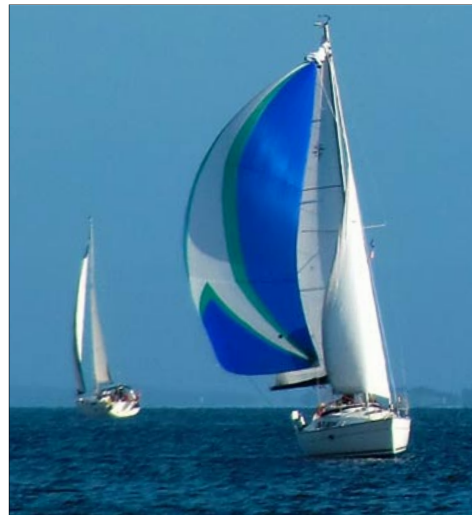
At komme først over mållinjen er en oplevelse, men betyder ikke jf. handicapreglerne, at du vinder.

på trods af Klokkeblomsts handicap med en uerfaren skipper blev hendes måltal undervejs ændret, så der skulle presses endnu mere fart ud af damen.