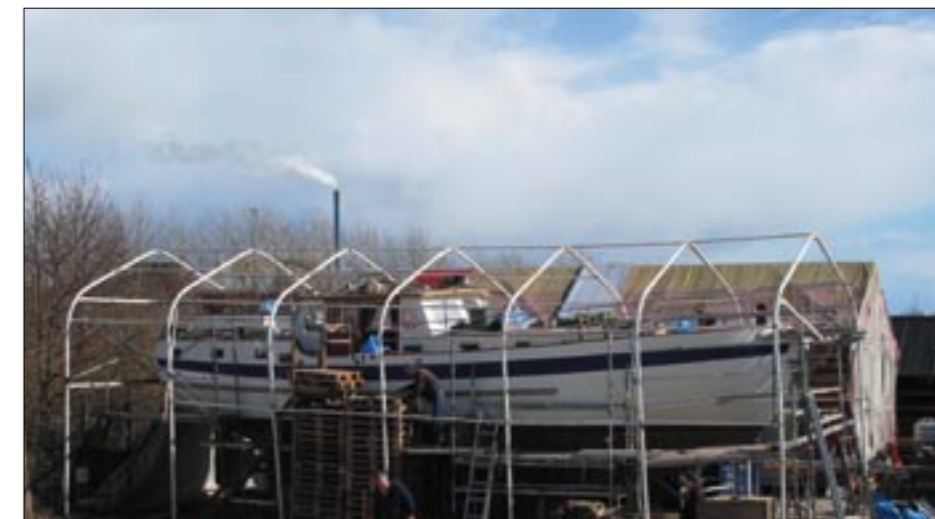
Cumulusskyerne er igen over Marselisborg Havn, og aktiviteterne er på sit højeste.

Så hermed kaster vi et nyt samlingspunkt på banen. På en række torsdage vil vi (bestyrelsen m.fl.) på skift sørge for, at der er tændt op i grillen udenfor sejlklubben fra kl.19. Tanken er så, at du selv medbringer det, du vil spise og drikke. Vi håber, at det vil friste mange til at nye maden sammen i det fri.