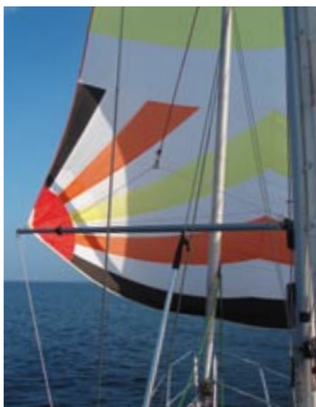
LM28 med staget spiller

Onsdagssejladserne, der sidst på året blev afviklet lørdag formiddag, blev i 2010 afviklet under meget forskellige vejrforhold, hvor kapsejladsledelsen var gode til at sætte fokus på de materielle belastninger og de sportslige konditioner, og derfor aflyste sejladser hvor vejret så ud til at blive for hårdt. Beslutninger jeg havde det godt med, da det at sejle gerne skal være en glæde og ikke en overlevelse. Med til de gode aftner og formiddage hører også tredje halvleg, hvor man samles