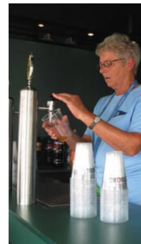
For at klare opgaverne skal vi som sidste år bruge mange frivillige hjælpere

For at gennemføre en sådan udstilling med succes, kræver det mange frivillige, der er interesserede i at bruge nogle timer på havnen og deltage i planlægningen og den praktiske gennemførelse i forbindelse med udstillingen. På nuværende tidspunkt er planlægningen i fuld gang og som det ser ud, er der lagt op til en stor og flot udstilling igen i år.