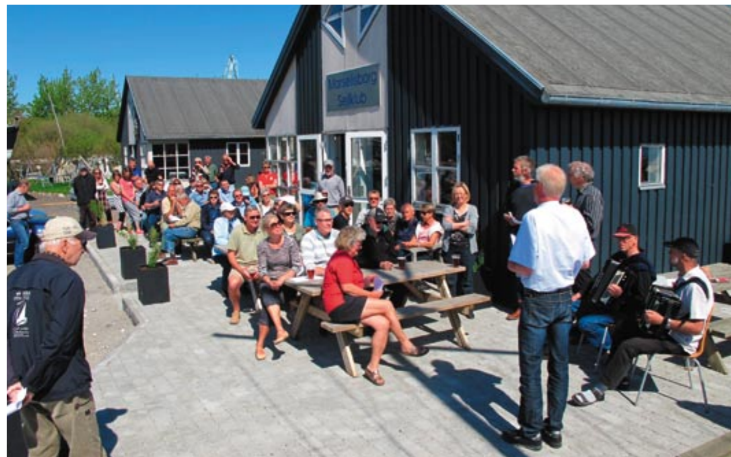
Traditionen tro blev sæsonen skudt i gang ved sejlklubbens klubhus. Klubstanderen blev hejst med både tale, musik og fællessang den 30. april.