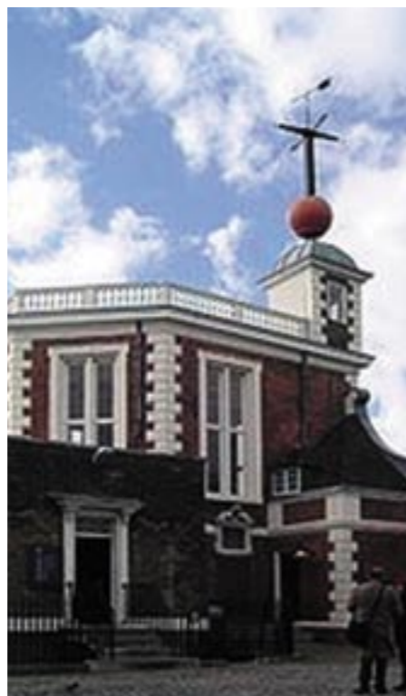
Greenwich observatoriet ved London.

Tid og klokkeslæt er flere forskellige ting. Al tidsregning baserer sig på Solens daglige bevægelse fra øst mod vest. Eller rettere sagt jordens rotation den modsatte vej. Midtvejs mellem solopgang og solnedgang står solen højest på himlen mod syd, og det er sand middag , der hvor jeg er. I Viborg er det først sand middag 3 minutter senere. Tidsforskellen ville gøre det svært, f.eks. at lave en køreplan for togdriften mellem Århus og Viborg.