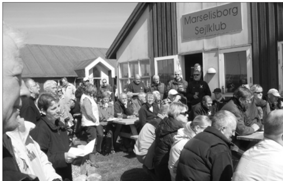
Standerhejsningen den 24. april 2010 ved klubhuset - sejlsæsonen er sunget, hejst og skudt i gang.