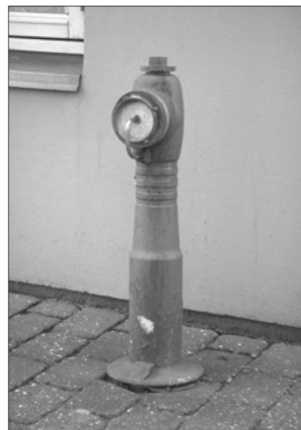
Hvor står denne brandstander?

brandslukningsmidler og hvordan disse skal anvendes i ulykkestilfælde. Brandvæsenet har givet tilsagn om at medvirke, bl.a. med demonstration af pulverslukkere, genoplivning m.m.