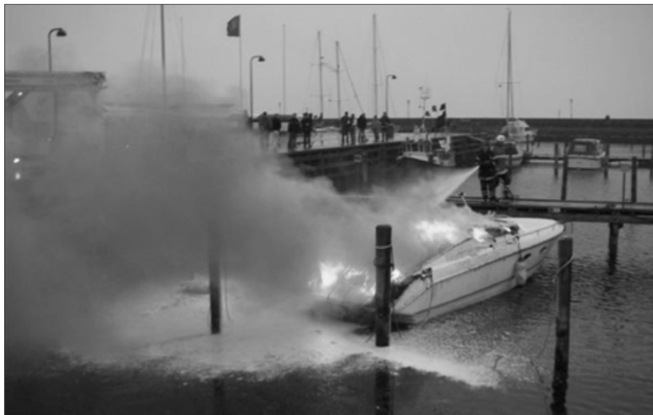
Bådbrande skyldes ofte fejl i el-installationen. En hurtig indsats kan være afgørende for at begrænse skaderne.

I løbet af de næste måneder går arbejdet ud på at rekruttere 10-12 "superbrugere", dvs. folk på broerne, der har lyst til at være aktivt med i projektet. Superbrugernes opgave vil være at lede første indsatsen i tilfælde af brand og redning, og de vil i første omgang blive gjort bekendt med beredskabsplanen, herunder alarmering, havnens rednings- og