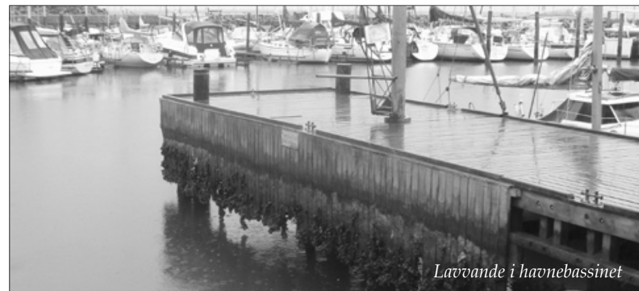
Lavvande i havnebassinet