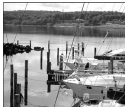
Indsejling vest mod Strandvejen lukkes.