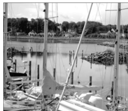
Indsejling øst renoveres.