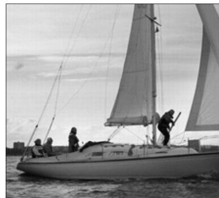
Der arbejdes ihærdigt på onsdagsbanen.

enkelte både fra det rigtige kapsejladssfelt og til slut deltog vi i aftersailing hyggen i klubhuset.