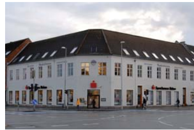
Viby Torv 2 • 8260 Viby J • Tlf. 87 34 65 00