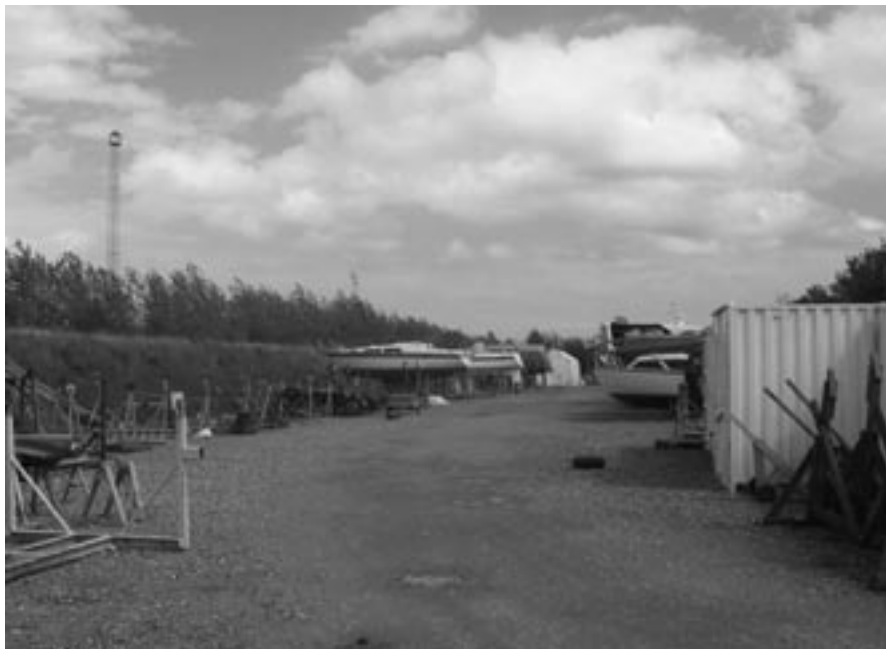
Det bliver svært at finde pladser til de 70-80 både, der har overvintret på dette område.

Havnens bestyrelse arbejder lige nu af al magt på at få en forhandling i gang med kommunen for at finde acceptable løsninger.