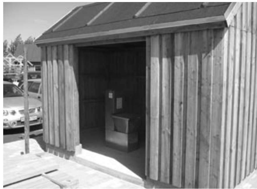
I det lille hus kan man nu tømme transportable toiletter. Vi håber, at brugerne vil hjælpe med at holde en høj hygiejnisk standard.

Selve byggeriet er i det store og hele ved at være afsluttet. Alle småfejl skulle fra totalentreprenørens side have været udbedret pr. 1. juni. I stedet modtog vi et brev fra entreprenørens advokat, hvori entreprenøren frasiger sig det forlig vedrørende fejl og mangler og betaling af dagbøder, der var indgået ca. tre uger tidligere. Specielt er der tale