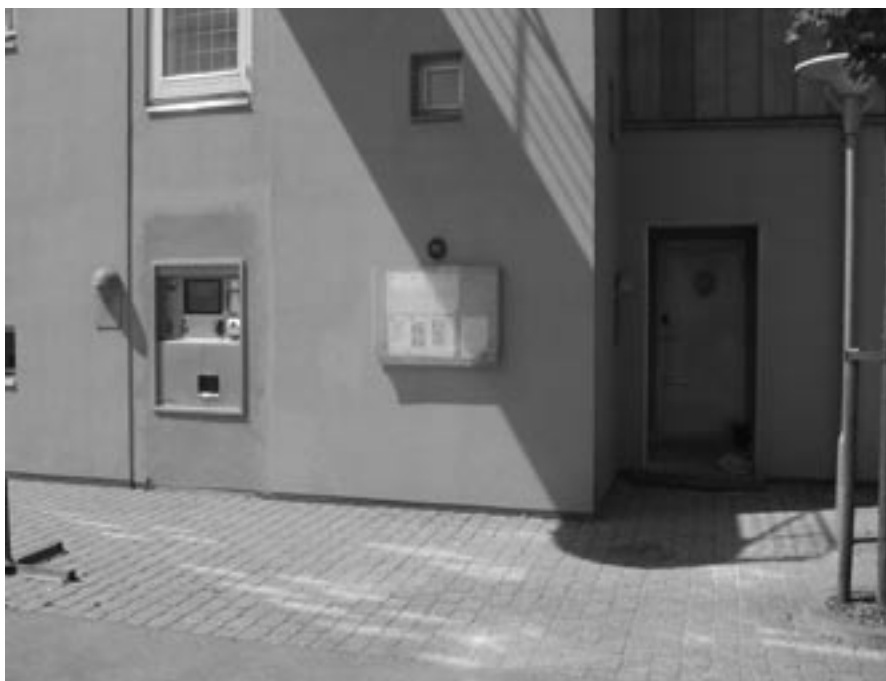
Betalingskort-automaten flyttes nu fra gavlen ind i gangen. Det giver mere læ for såvel brugere som automat. I stedet kommer der et vindue ind til havnekontoret.

Flytningen har medført en del støj og støv i gangen, hvilket vi beklager meget, men det betyder, at vi gerne skulle undgå driftsforstyrrelse på automaten og derved give alle, der bruger automaten en bedre service.