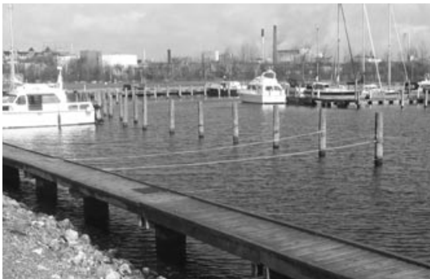
Renoveringen af bro 1 begynder snart. Dækket skal udskiftes og samtidig undersøges, om broen kan hæves lidt.