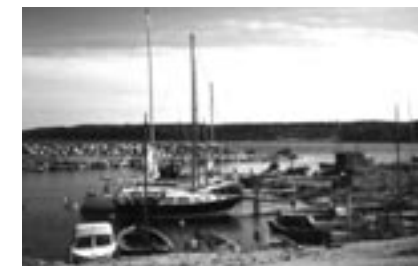
Skuret til højre i billedet var klubbens første klubhus

Her opstod således en slags uofficiel havn eller en "Pirathavn" som nogen kaldte den, og af forhåndenværende materialer blev der bygget primitive broer og fortøjningsanlæg, der kunne lette adgangen til