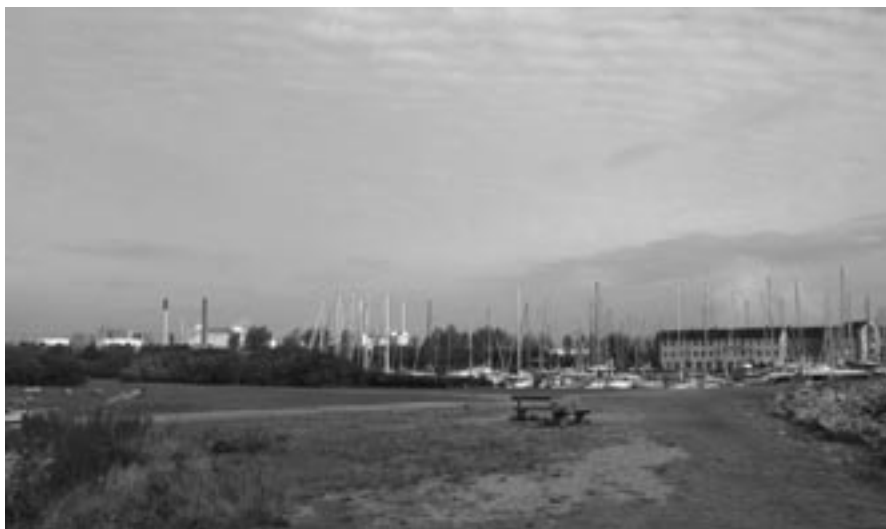
Der er god plads til Roklubben her på spidsen af Tangkrogen