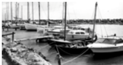
Primitive broer og fortøjningspæle i lagunen

tiv til, at arbejde på at få etableret en "rigtig" havn med ordentlige bro og moleanlæg, hvor man ikke behøvede, at gå med gummestøvler i mudder efter regnvejr, og hvor der var ordentlige tilkørselsforhold osv. Adgang til lagunen var dengang til fods over tangkrogen - eller man