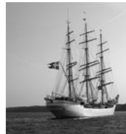
Hvor er klubstanderen?