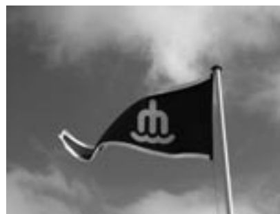
Den er da smuk!