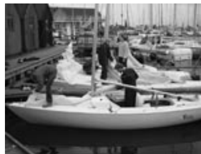
Travlhed før træning