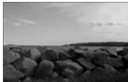
Udsigt fra terræn