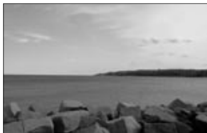
Udsigt fra højen