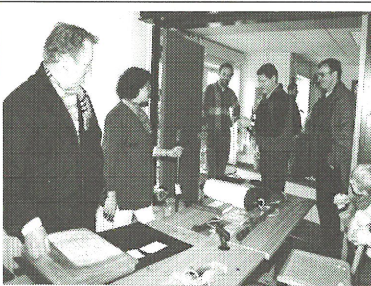
Grejmarked i messen Lørdag den 18 marts: