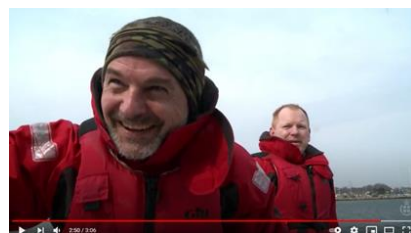
Foto fra Forsvarets film om sejlads for psykisk skadede veteraner

På sigt, vil der være en projektbeskrivelse som man bare kan tage fat i og invitere en veteran med på sejltur og forhåbentligt, lave et forløb med henblik på, at vi kan tage et socialt ansvar, give skønne oplevelser til andre og gøre Marselisborg Sejlklub til et endnu skønnere sted at være.